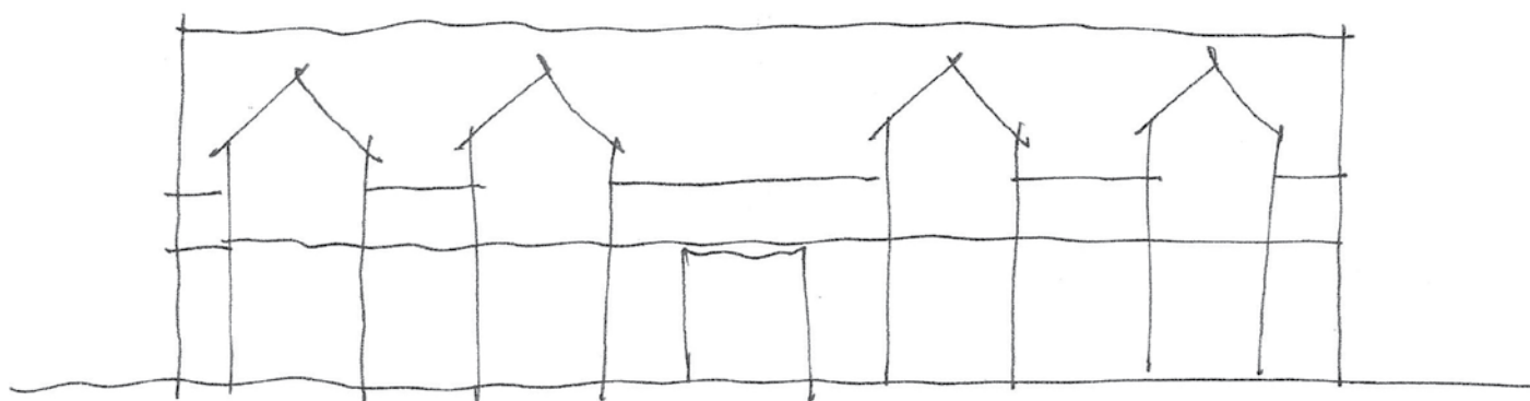
Nye byggefelter til fremtidig byggeri ved Bryggen sikrer mulighed for udvikling og fortætning. Bebyggelsens volumen ændres derved ikke væsentligt, selvom der sker en variation.