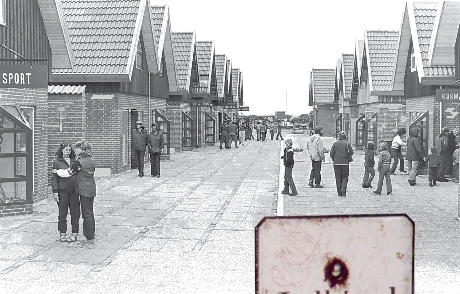
Inspiration til skiltning kan hentes i stedets historie. Billedet ovenfor er fra Bryggen, Bork Havn 1987.