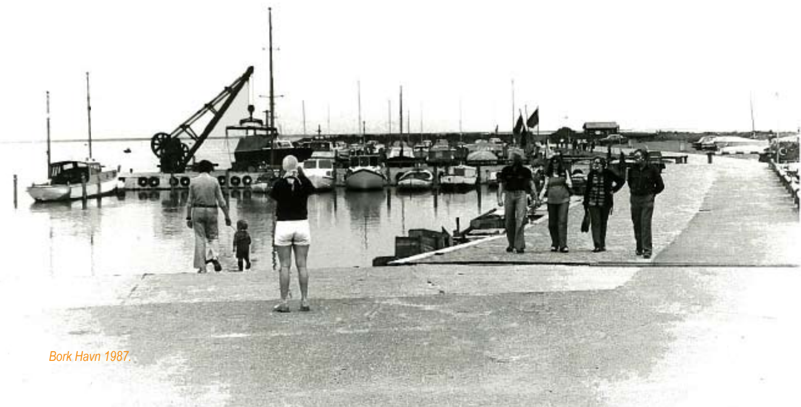
Bork Havn 1987.