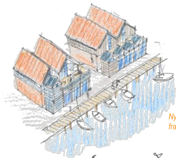
Nye byggefelter til fremtidig byggeri ved Bryggen. Udtrykkes ændres fra ensformigt til varieret og mere tilfældigt.