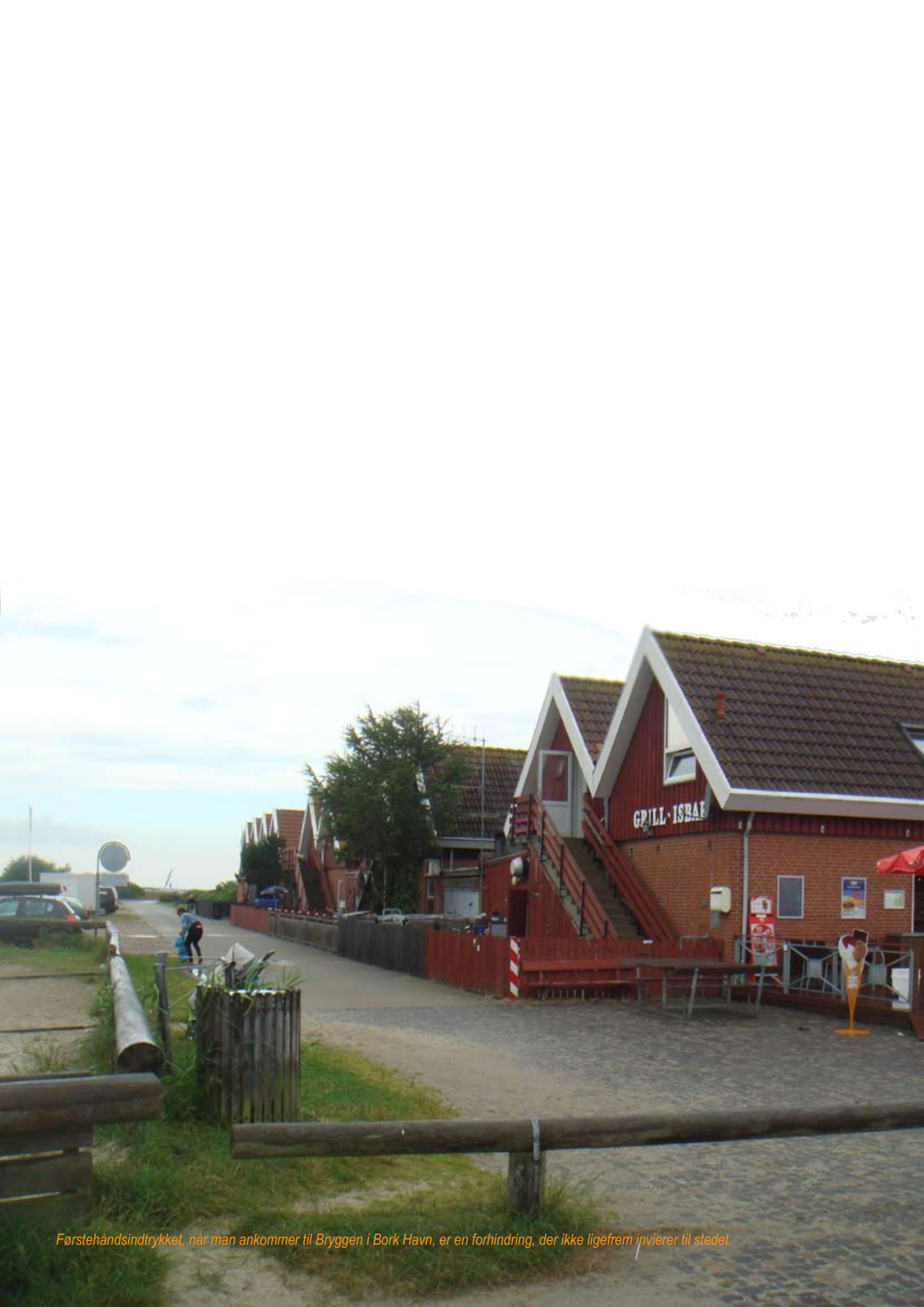
Førstehåndsiendtrykket, når man ankommer til Bryggen i Bork Havn, er en forhindring, der ikke ligefrem inviterer til stedet.